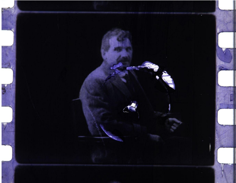
Imagen 1: UY UDELAR AGU AIH-LAPA-SE-106:Fotograma de la película Actividades San José n°5 (Juan Chabalgoity, San José Films, 1926 C.) Soporte original: positivo, monocromo con fragmentos coloreados, 35mm, nitrato, silente. Película perteneciente al Archivo Fílmico y de la Imagen de San José-Colectivo Los filmadores y Homero Pugliese, depositado en Cinemateca Uruguay. Digitalización realizada en 2022, en el marco de los planes de GESTA.

Por último se recoge en La memoria audiovisual en la comunidad , algunas de las actividades realizadas, través de los Espacios de Formación integral (EFI) y proyectos de extensión, transcurridos entre los años 2018-2022, donde participaron estudiantes de la Facultad de Información y Comunicación, Instituto de Profesores Artigas, Facultad de Psicología y Facultad de Humanidades. Entre las diversas tareas se ingresaron a base de datos, procesaron, inspeccionaron y digitalizaron, archivos de Acción Sindical Uruguay (ASU), Asociación de Bancarios del Uruguay (AEBU), Servicio de Paz y Justicia (SERPAJ), Archivo de Tomás Olivera. Además se expone la experiencia del colectivo Memorias Magnéticas con el patrimonio audiovisual y los Derechos Humanos en Uruguay.